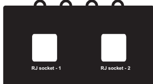
Front of UB 4.0