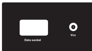
Back of UB 4.0

RJ gniazda: - Gniazdo Rj 1 - dla większości oprogramowania. (Fbus and Mbus transmisja). - Gniazdo Rj 2 - dla oprogramowania Dejana.